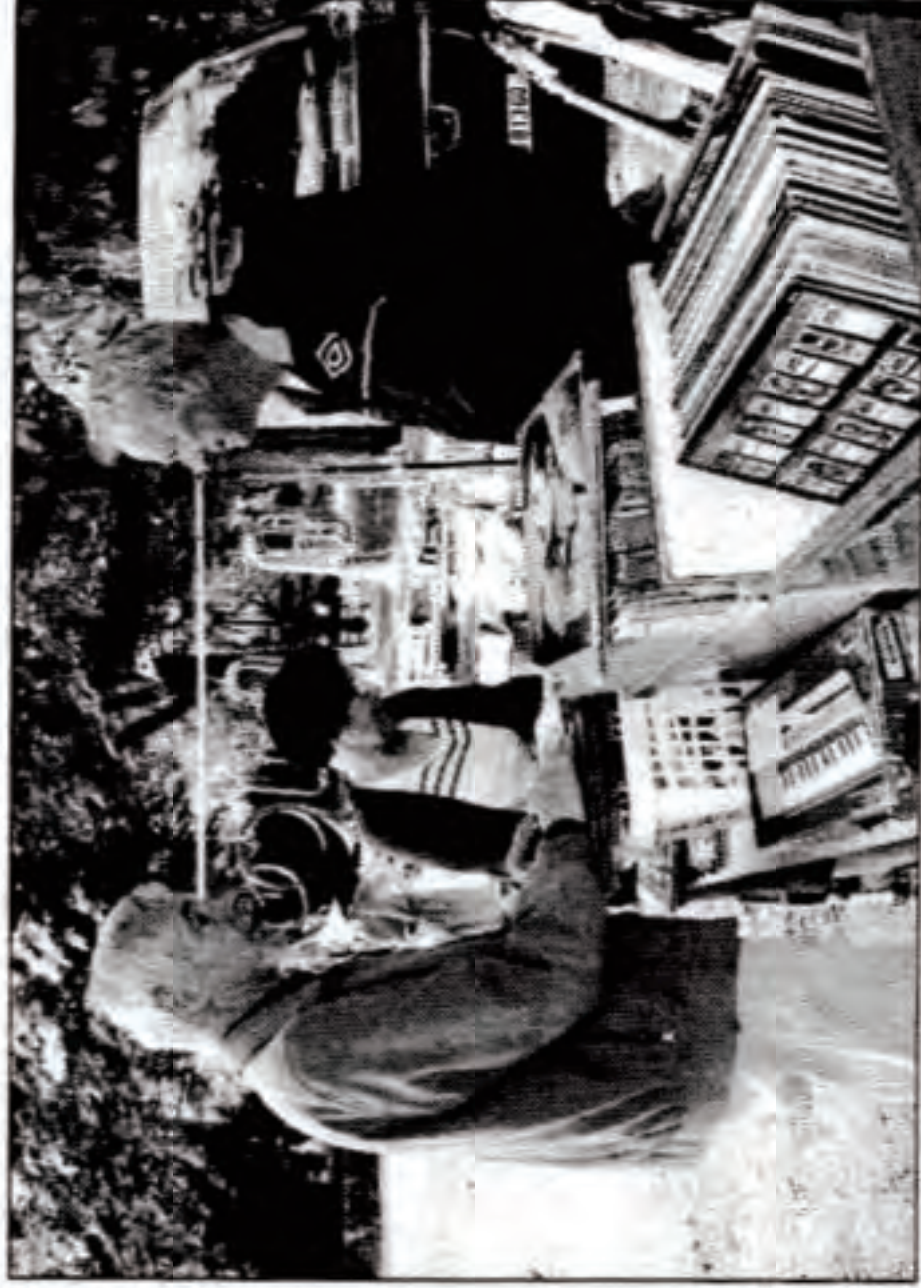
Quelques chineurs à la recherche de bonnes affaires.