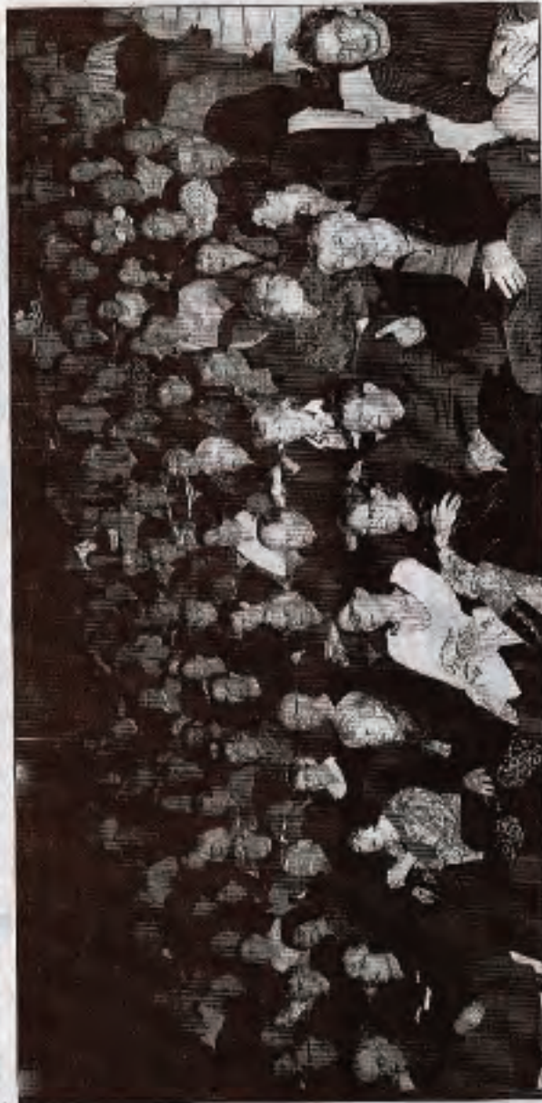
L'Embarcadere affichait salle comble dimanche soir.