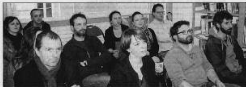
Les différents acteurs culturels du département participent à l'organisation du festival.

- Samedi 28 mars : Brand New Idea à 20h30 à l'espace culturel du Montel de Montbrison-sur-Loire, Mardi Gro Brass Band à 20h30 au théâtre municipal d'Yver-