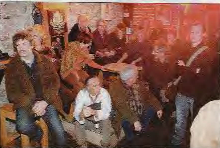
Auz, en Velay possède une public, le jeudi et le vendredi soir.