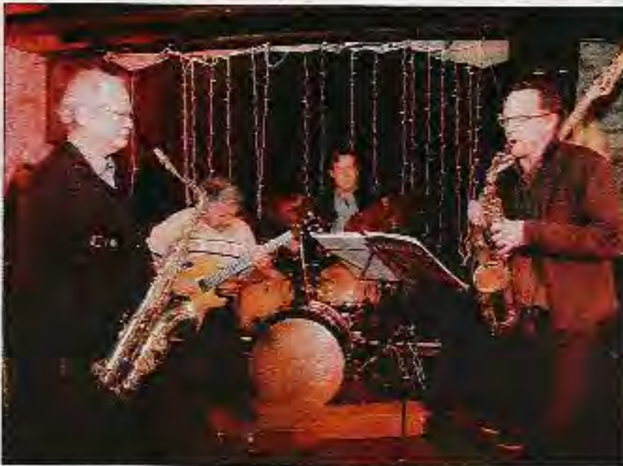
Le temps d'une soirée, de petits groupes se forment, au gré des affinités.

Cette pièce grande comme un morceau de poche, avec ses pentes raides au plafond et ses