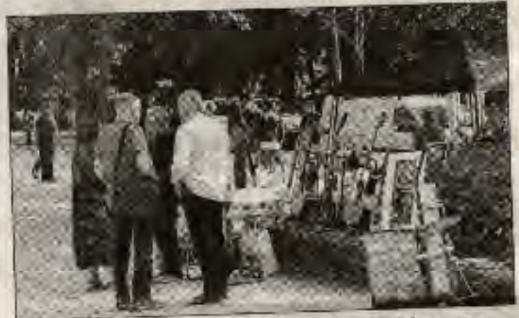
Quelques instruments étaient proposés à la vente.

Quelques pièces "rares" étaient aussi mises en vente, des partitions anciennes datant du début du XX e siècle, ou encore des instruments ayant un certain "vécu", comme cette guitare manouche, fabriquée à Lyon, de facture assez sim-