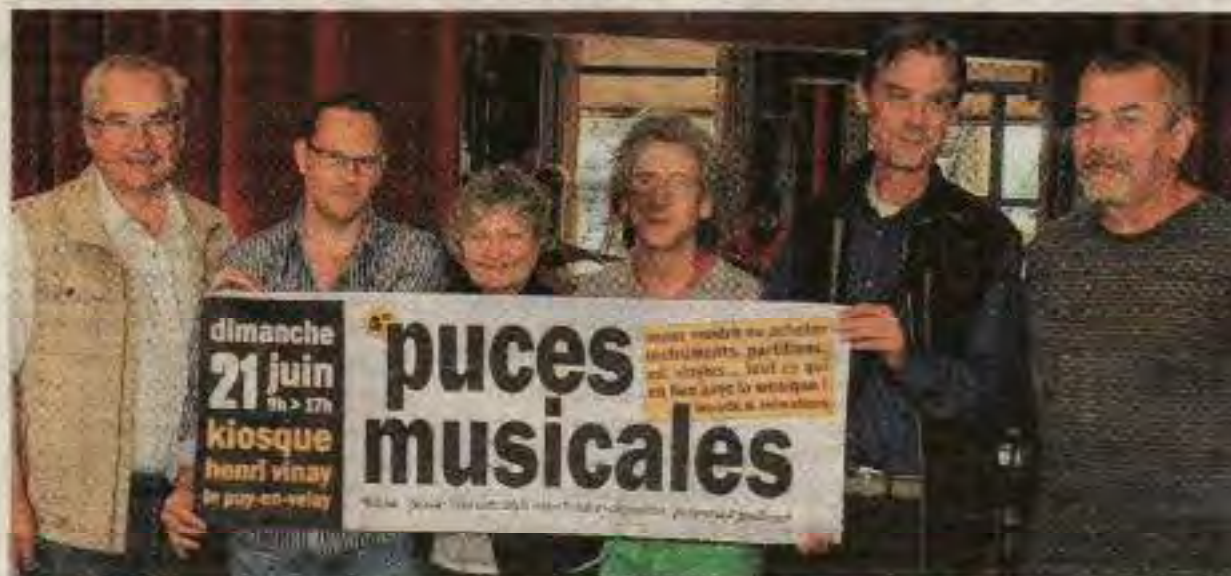
Musiciens et amateurs de jazz ont présenté l'affiche des puces musicales.

Haute-Loire. L'association reste active ces jours-ci et pendant l'été en proposant des puces musicales, émission de radio, stage, jam-session et conférence.