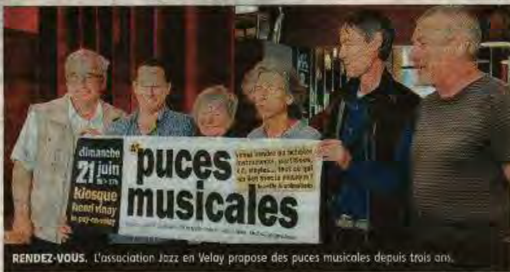
RENDEZ-VOUS. L'association Jazz en Velay propose des puces musicales depuis trois ans.

Le principe est simple : de 9 heures à 17 heures, au kiosque du jardin Henri-Vinay, les brocanteurs du dimanche sont invités à vendre tout ce qui est en lien avec la musique. CD, vinyles, partitions, accessoires, guitare, violon et autres instruments sont les bienvenus. Tout le res-