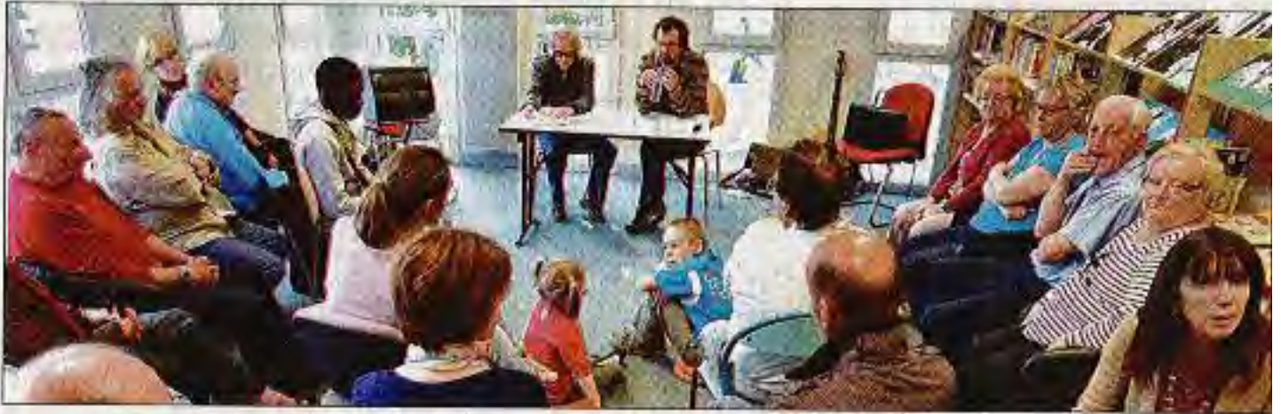
Une belle assistance pour un très bon moment "jazzy..."

Vendredi dernier, à la médiathèque de Vorey, en fin d'après-midi, était donnée une conférence musicale, ayant pour thème le "Swing Manouche", et pour référence le créateur et promoteur du genre, et toujours le meilleurs d'entre tous, Django Reinhard.